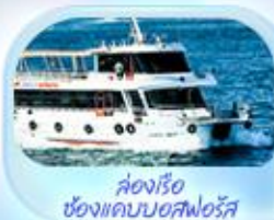
ล่องเรือ ช่องแคบบอสฟอรัส