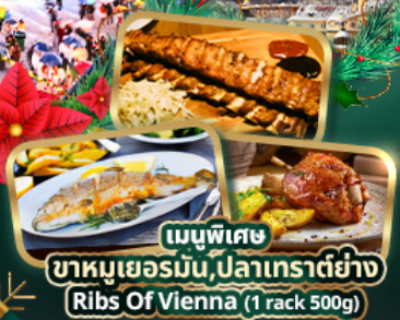
เมนูพิเศษ หมูเยอรมัน, ปลาเทราต์ย่าง Ribs Of Vienna (1 rack 500g)