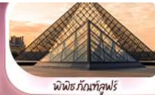
พิพิธภัณฑ์ลูฟร์