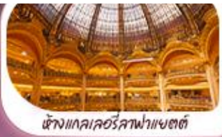
ห้างแกลเลอรีสภาฟ้าเบตต์