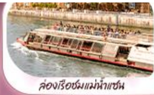
คลองเรือชมแม่น้ำแซน