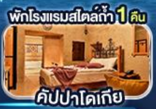
พักรวมแรมสไตลัท้า 1 คืน คับปาโดเกีย

พิเศษ! ล่องเรือชมความสวยงามช่องแคบ 2 ทวีป "ช่องแคบบอสฟอรัส"