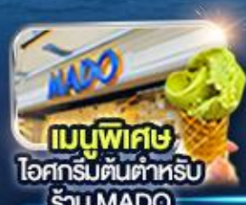
เมนูพิเศษ ไอศกรีมต้นตำหรับ ร้าน MADO