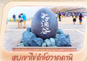
ซุบเข่าโซด้าโอวาคุดานิ

สายการบิน AirAsia X (XJ) น้ำหนักกระเป๋า 20 KG