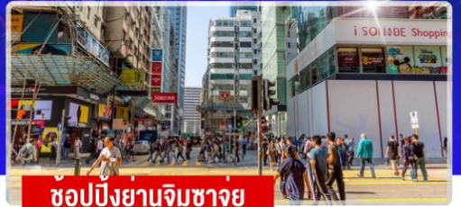
ช้อปปิ้งย่านจิมซาจุ่ย