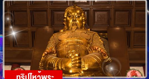
ทริบิ้วพระ: