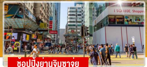
ช้อปปิ้งย่านจิมซาจอย