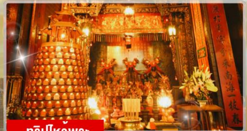
ทริบไหว้พระ