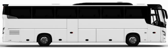
ตัวอย่างรูปภาพรถ 1 ชั้น

หากประเภทห้องที่ท่านริเวสมาเต็ม อาทิ เช่น ริเวสห้องพักเป็น TWIN BED หรือ DOUBLE BED ทางบริษัทขอสงวนสิทธิ์ในการปรับประเภทห้องพัก เป็นตามที่โรงแรมมีอยู่ โดยไม่ต้องแจ้งให้ทราบล่วงหน้า