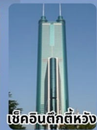
เขาคิงตี๊กตีห้วง