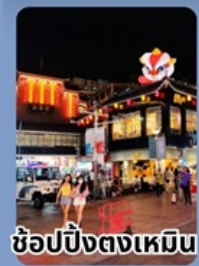
ช้อปปิ้งตงเหมิน