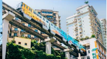
รถไฟฟ้าทะเลตึก

*ทางบริษัทฯ ขอสงวนสิทธิ์ในการสลับโปรแกรมทัวร์ตามความเหมาะสมขึ้นอยู่กับสถานการณ์หน้างาน โดยคำนึงถึงผลประโยชน์ของลูกค้าเป็นสำคัญ