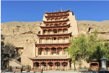
ถ้ำหินมั่วเกาคุ

พักที่ METRO PARK HOTEL โรงแรมระดับ 4 ดาวหรือเทียบเท่าในเมือง둔หวง