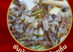
ชั้นนักจ๊อ อาหารท้องถิ่น