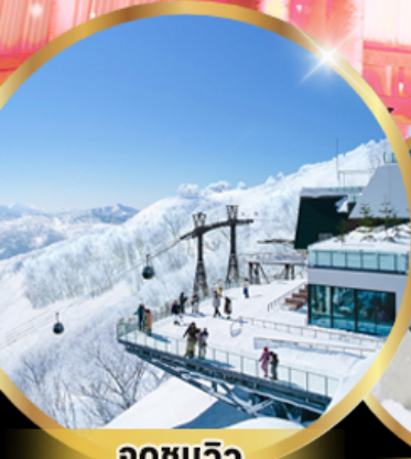
จุดชมวิว Unkai Terrace