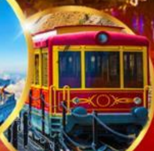
รถรางซาปา