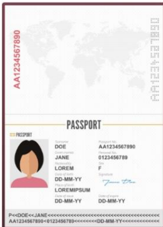
รูปถ่ายหน้าพาสปอร์ต