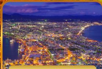
ชมวิวดาโกดาเตะ