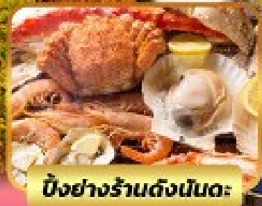
ปิ้งย่างร้านดังเน้นตะ