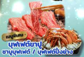
เมนูพิเศษ บุฟเฟ่ต์ข้าว ซาซิมิบุฟเฟ่ต์ / บุฟเฟ่ต์บิงชัง