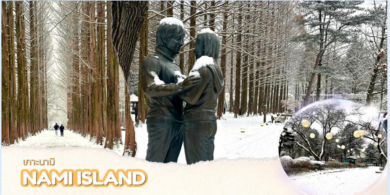
เกาะนามิ NAMI ISLAND

เรือเฟอร์รี่ข้ามไปโดยใช้เวลาประมาณ 10 นาที เกาะนามิ แหล่งท่องเที่ยวที่มีชื่อเสียงของเกาหลีใต้ที่สามารถท่องเที่ยวได้ทั้งปี ตั้งอยู่กลางทะเลสาบซองเพียง บนเกาะจะมีบรรยากาศร่มรื่นเต็มไปด้วยต้นสน ต้นเกาลัด ต้นแปะก๊วย ต้นซากุระ ต้นเมเปิ้ล และต้นไม้ดอกไม้อื่นๆที่ผลัดกันออกดอกเปลี่ยนสีให้ชมกันทุกฤดูกาล บรรยากาศหนาวๆ มีหิมะปกคลุมก็จะอยู่ในช่วงเดือนธันวาคม-มกราคม เกาะนามิโด่งดังจาก ซีรีส์เรื่อง Winter Love song โดยใช้เกาะนามิเป็นสถานที่ถ่ายทำ มีคู่รักมากมายมักไม่พลาดที่จะมาถ่ายรูปกับจุดไฮไลต์บนเกาะสุดโรแมนติก Winter Sonata's First Kiss รูปปั้นคู่พระ-นาง จากซีรีส์เรื่องดัง ใกล้กันนั้นยังมีโซนอาหารทั้งร้านอาหารแบบนั่งทาน ร้านปิ้งย่าง และซาลาเปาหนึ่งเตาถ่านแบบโบราณ