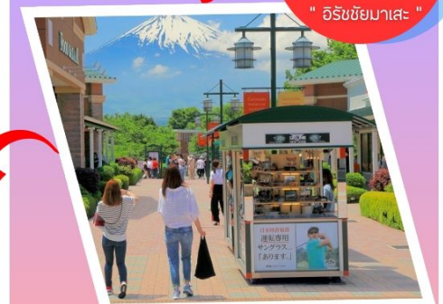
โทเทมบะ: เอาท์เลท