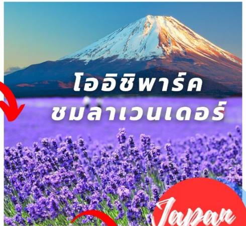
โออิชิพาร์ค ชมลาเวนเดอร์