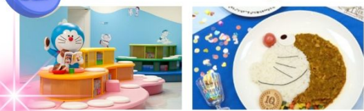
พิพิธภัณฑ์ฟูจิโอะ ฟูจิโกะ