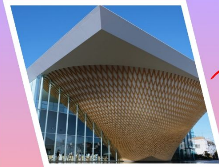
พิพิธภัณฑ์ ฟูจิกลับหัว