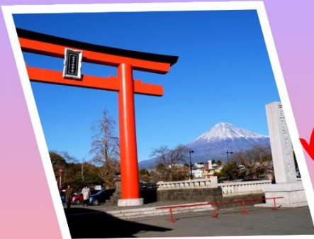
ศาลเจ้าฟูจิเซ็นเก็น