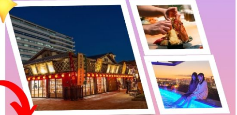
จุดเช็คอินใหม่ TOYOSU SENKYAKU BANRAI