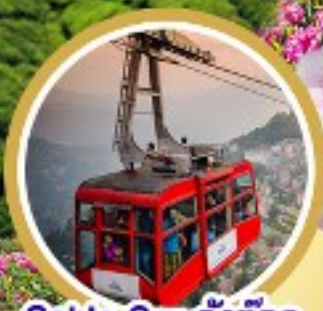
Cable Car ถึงตอก