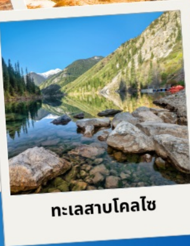
ทะเลสาบโคลไซ