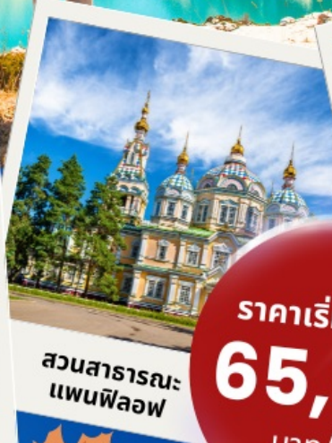
สวนสาธารณะแพนฟีลอฟ