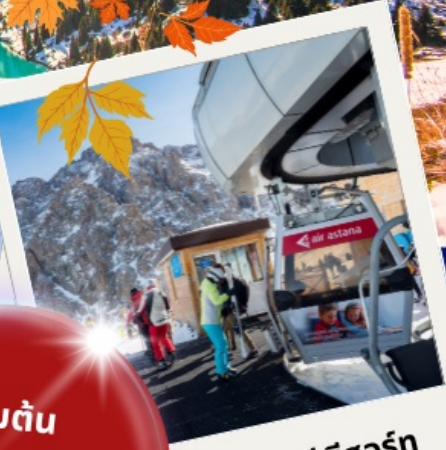
ซิมบูลัก สกี รีสอร์ท