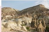
หุบเขาเดเฟเนิร์ต

** พักที่ DEDELI CAVE HOTEL 5* หรือเทียบเท่า **