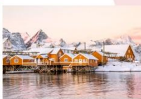
หมู่บ้าน Sakrisoy