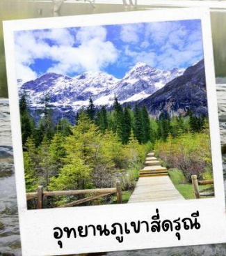
อุทยานภูเขาสี่ตรุณี