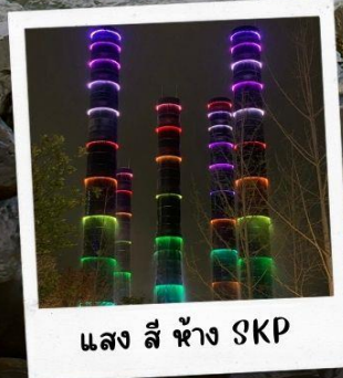
แสง สี ห้าง SKP