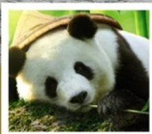
ศูนย์หมีแพนด้า

จาก 8 ชม. เหลือ 2 ชม. เร็วทันใจด้วยรถไฟความเร็วสูง เฉิงตู - จิวจ้ายโกว