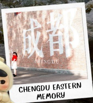
CHENGDU EASTERN MEMORY