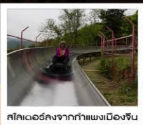
สลิเดอร์ลงจากกำแพงเมืองจีน