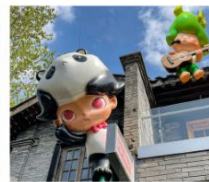
ถนนคนเดินชอยกว้างแคบ