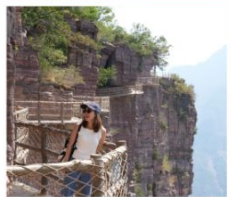
เขาเทียนเจียซาน