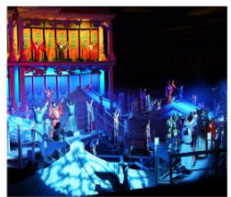
โรงละคร ONLY HENAN