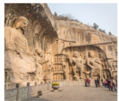
กำหินหลงเหมิน