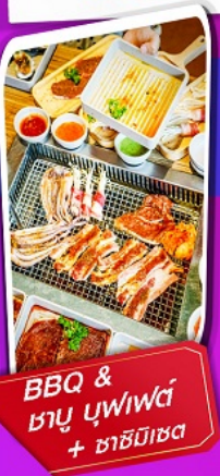
BBQ & ภูเขา บุฟเฟ่ต์ + ซาชิมิสด

บุฟเฟ่ต์นานาชาติ บนบ้านน้ำฮิลล์ 1 มื้อ และ SEAFOOD 1 มื้อ