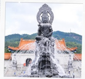
วัดพุทโธ