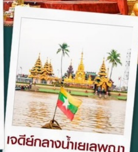
เจดีย์กลางน้ำเยเลพญา