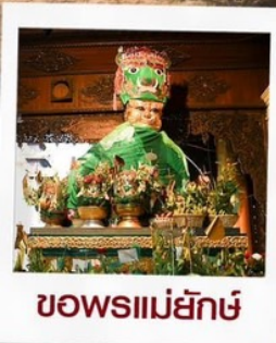
ขอพรแม่ยกษ์