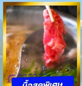
มือสุดพิเศษ