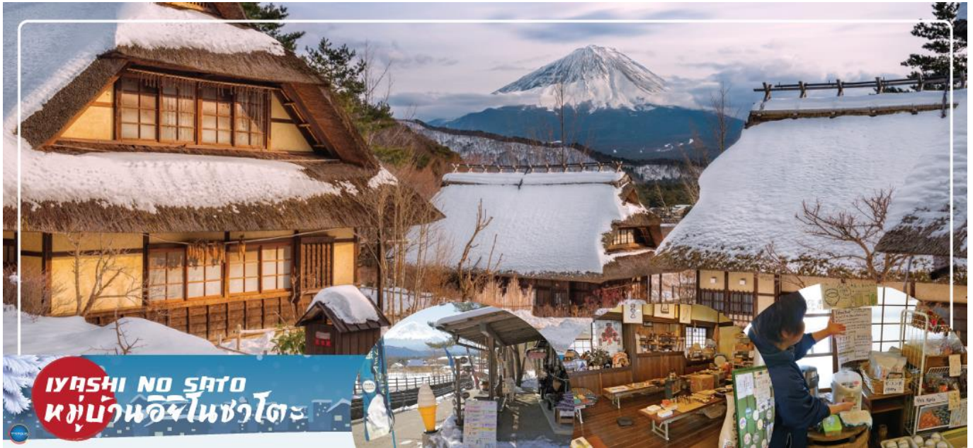
IYASHI NO SATO หมู่บ้านอิซาโนซาโตะ

เดินทางสู่ พิพิธภัณฑ์หมู่บ้านอิยาชิโนซาโตะ (Iyashi no Sato) ในพื้นที่ที่เคยเป็นหมู่บ้านเกษตรกรรมบนชายฝั่งทิศตะวันตกของ ทะเลสาบไซโกะ (Lake Saiko) ซึ่งถูกพายุไต้ฝุ่นพัดถล่มในปี ค.ศ.1966 จนกระทั่งต่อมาอีก 40 ปีได้รับการบูรณะขึ้นใหม่ให้เป็นแบบดั้งเดิม และเปิดเป็นพิพิธภัณฑ์กลางแจ้งให้ ประชาชนได้เข้าชมศึกษาเรียนรู้เกี่ยวกับวัฒนธรรม ลองและซื้อสินค้าหัตถกรรมแบบดั้งเดิม ภายในหมู่บ้าน ประกอบด้วยบ้านกว่า 20 หลังคาเรือน ในอาคารแต่ละหลังนอกจากกิจกรรมงานฝีมือแบบดั้งเดิมแล้ว ยังสามารถชมพิพิธภัณฑ์และแกลลอรี่, ซื้อสินค้าพื้นเมือง, เพลิดเพลินกับร้านน้ำชาและร้านอาหาร นอกจากนี้ยังมีจัดอีเวนท์แบบโบราณให้เข้ากับฤดูกาลด้วย