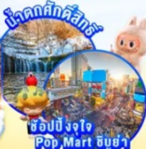
ช้อปปิ้งจ๊อย Pop Mart ชิบูย่า