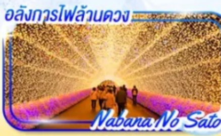
Nabana No Sato