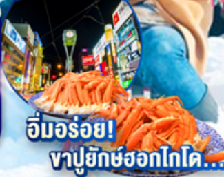
อิมมอร์ออย! ซาปูยักซ์ฮอกไกโด...

ไฮไลท์!! สนุกสนาน ณ ลานสโนว์ เวิลด์ ซึคิโซฟานอราฆ่า ผนังความสวยงาม วิจิตรตระการตา ณ พิพิธภัณฑ์หิมะ-ไอซ์พาววิลเลี่ยน เติมนม คลองโอตารุ ในบรรยากาศสุดแสนโรแมนติก ซ้อปิ้งจุใจ อีออน เมืองอาซาฮิกาว่า และ ย่านซูซุกิโนะ อิมมอร์ออย! ซาปูยักซ์