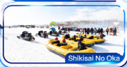
Shikisai No Oka