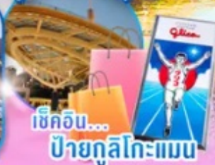
เช็กอิน... ป้ายกูลิโกะแมน

ไฮไลท์!! สัมผัสวัฒนธรรมเมืองอูจิ แหล่งปลูก "ชาเขียวอูจิ" ที่ดีที่สุดในโลก วัดเมียวไดอิน แห่งอูจิเป็นมรดกโลกที่มีประวัติยาวนานหนึ่งพันปี ชม หมู่บ้านมรดกโลกการันตีโดย UNESCO ณ หมู่บ้านชิราคาวาโกะ ช้อปปิ้งจุใจ ย่านซากาเอะ ย่านชินโซบาชิจิ ป้ายกูลิโกะแมน แห่งโดทงโบริ