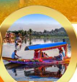
ล่องเรือซิคาร์่า