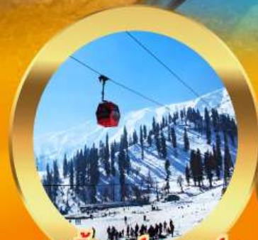
เคเบิลคาร์ กุลมาร์ค