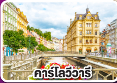
คาร์โลวารี