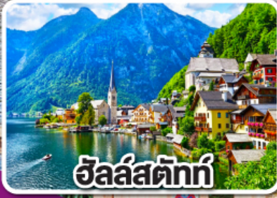
อัลสตัดท์