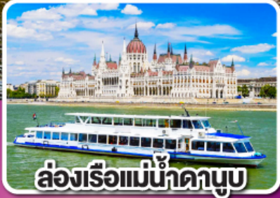
ล่องเรือแม่น้ำดานูบ