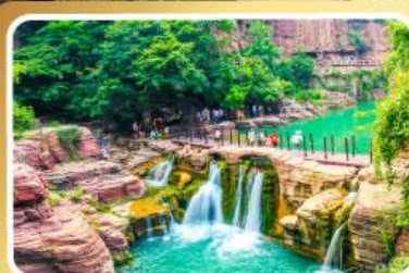
อุทยานหยุ่นโกซาน