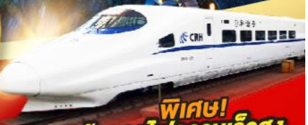
พิเศษ! เดินทางด้วยรถไฟความเร็วสูง