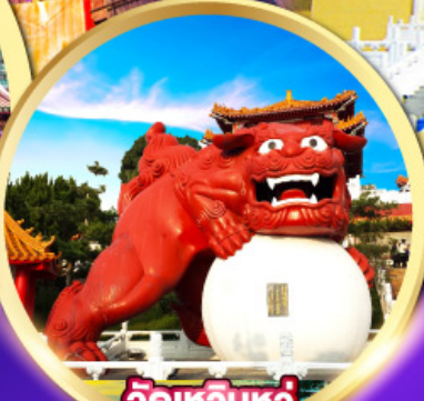
วัดเหวินหวั่น