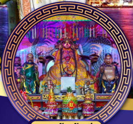
ศาลเจ้าหังเจีย