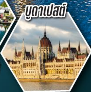
บูดาเปสต์