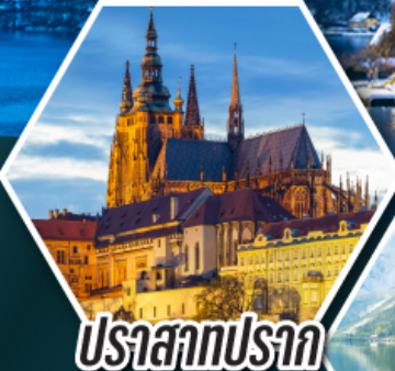
ปราสาทปราก