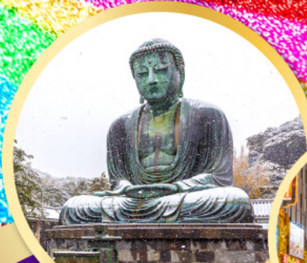
หลวงพ่อโตโคบูตสึ