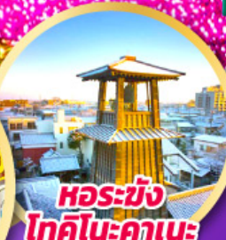
หอรบั้ง โทคิโนะคานะ