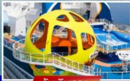
วันเดินทาง