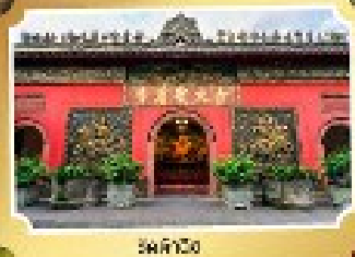
พระราชวัง