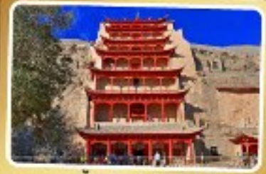
ถ้ำแกะสลักม่อเกา