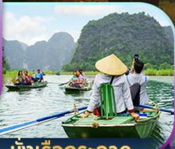
นั่งเรือกระจัด