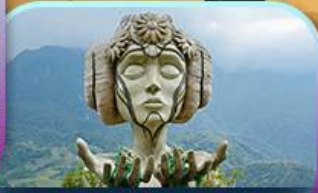
Moana Sapa Cafe