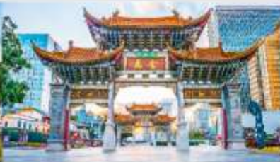
ประตูม้าทอง ไถ่หยก