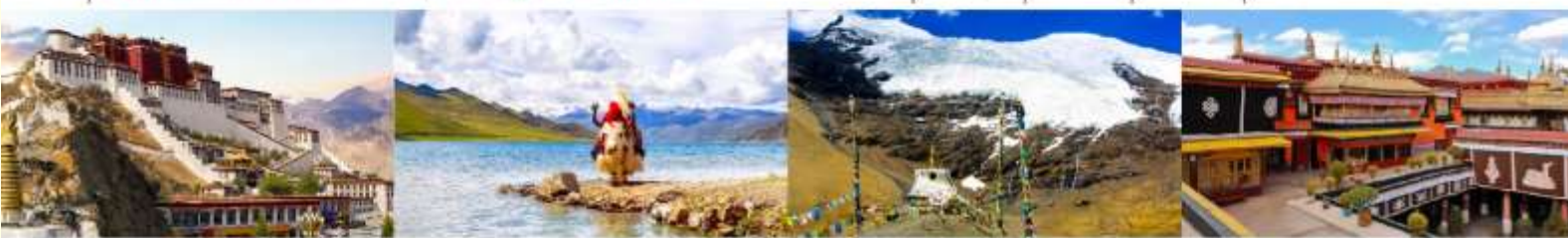
พระราชวังโปตาลา