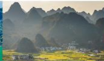
ป่าภูเขามื่นยอด