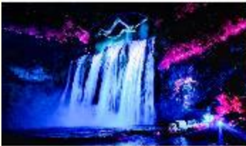
อุทยานน้ำตกหวงโก๋ซู่