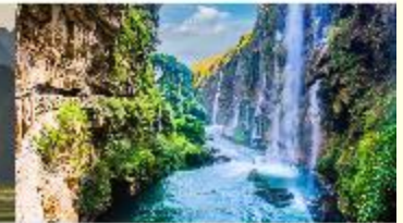
ชุมชนน้ำตกร้อยสายหม่าหลิงเหอ

*ทางบริษัทฯ ขอสงวนสิทธิ์ในการสลับโปรแกรมทัวร์ตามความเหมาะสมขึ้นอยู่กับสถานการณ์หน้างาน โดยคำนึงถึงผลประโยชน์ของลูกค้าเป็นสำคัญ