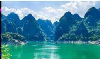
ทะเลสาบวันฟงหู