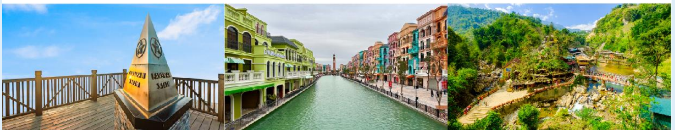
ยอดเขาฟานซิปิน