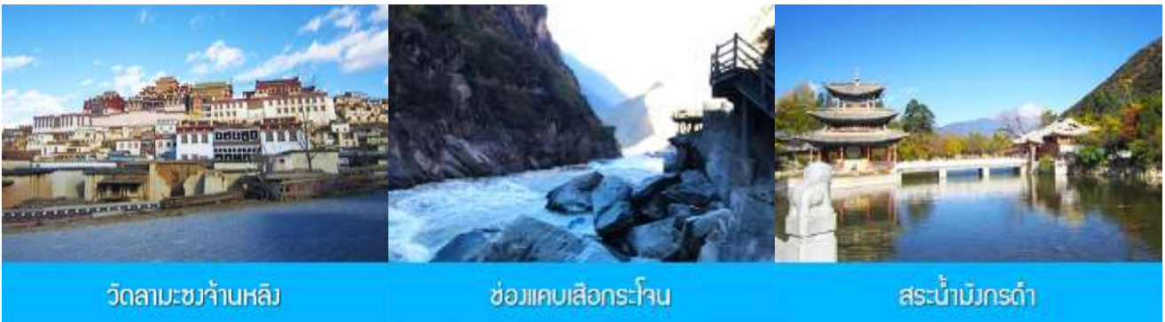
วัดลามะซวงจ้านหลิง