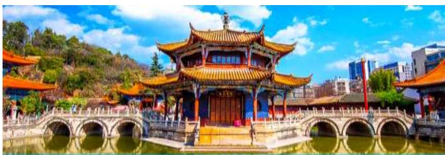
วัดหยวนกวง