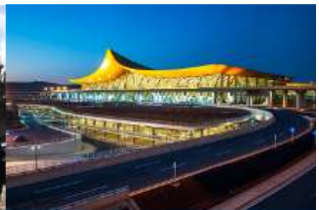
สนามบินเมืองคุนหมิง

วันที่ห้า เมืองต้าหลี่ – เมืองคุนหมิง-วัดหยวนทง-เมืองโบราณกวนตุ๋- KUNMING WATERFALL PARK