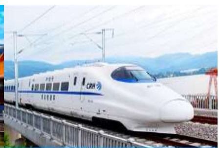
นั้รรถไฟความเร็วสูง

วันแรก กรุงเทพฯ-ดอนเมือง-คุนหมิง-วัดหยวนทง-นั้รถไฟความเร็วสูงู่เมืองต้าลี่