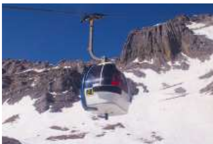
ภูเขาหิมะมังกรหยก (มังกรชะไห่ใหญ่)

ที่พัก FENG HUANG HOTEL ระดับ 4 ดาว หรือเทียบเท่าเมืองลี่เจียง