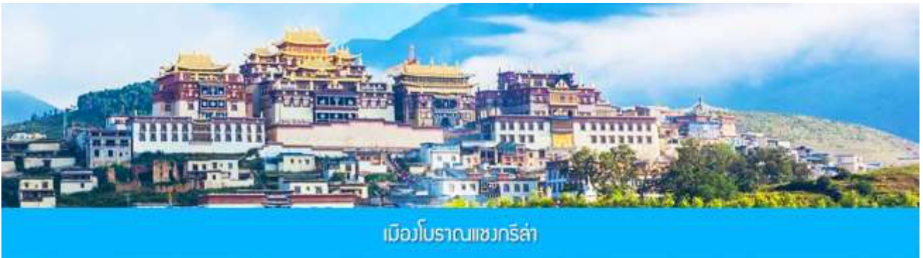
เมืองโบราณแขวงกริลา

จากนั้นนำท่านชม หมู่บ้านชีโจวหรือหมู่บ้านชาวไต้ ชมพื้นเมืองที่สำคัญของเมือง ชมการแสดงของชนชาติป๋ายพร้อมชิมชาสามแก้ว เพื่อรำลึกถึงวิถีชีวิตและการเกิดมาเป็นมนุษย์ของตนเอง ซึ่งถือเป็นเอกลักษณ์ของชนชาวไต้ ที่หาดูได้ยาก