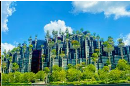
ตึกเทียนอัน (อาคารไต้ผิงตัน )