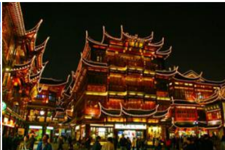
ย่านฉงหวงเมี่ยว